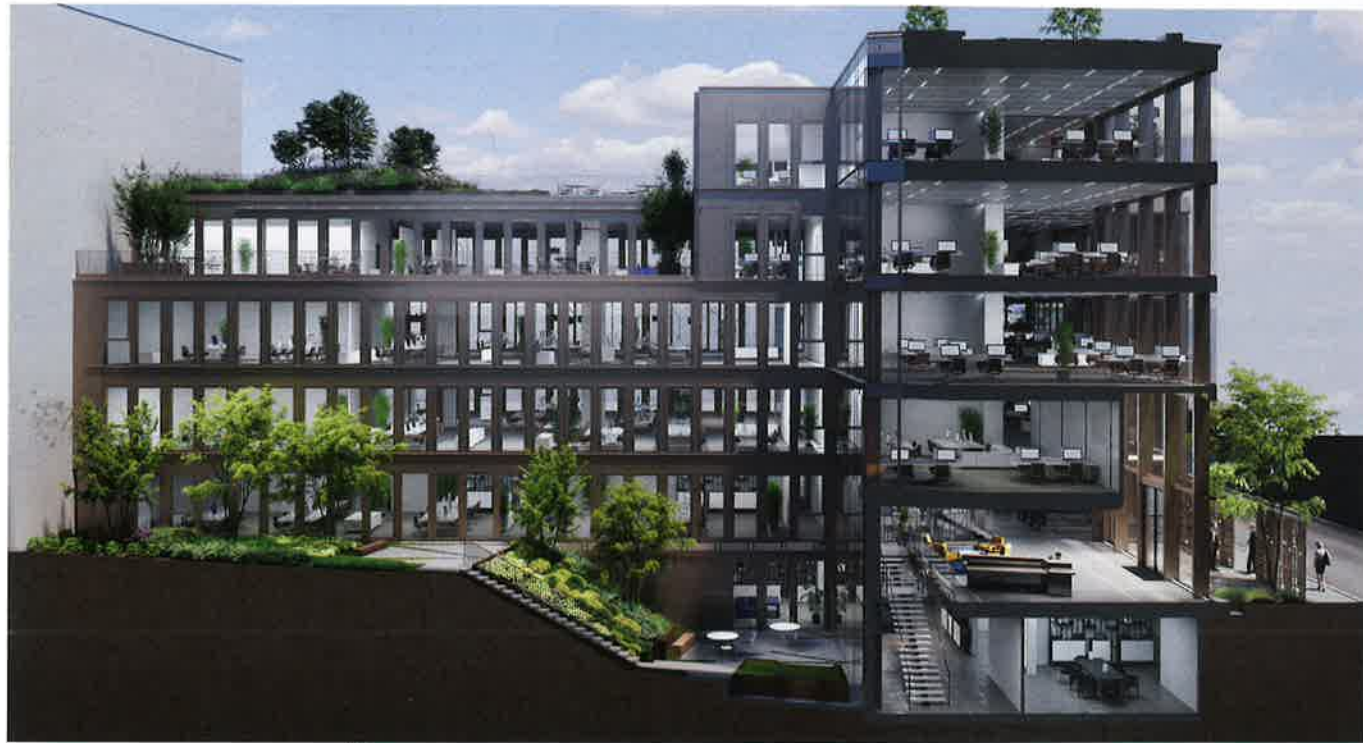
Doc. : Conception - Iceberg

Un ouvrage unique, mais perçu comme deux entités reliées par un bâtiment-passerelle transparent : imaginé par l'agence Lobjoy & Bouvier & Boisseau, l'immeuble Pergolese est conçu comme un édifice « ouvert et responsable » conjuguant évolutivité, flexibilité et modularité.